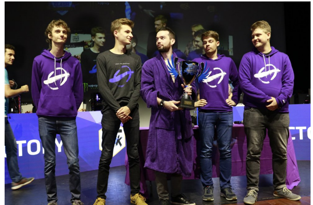
Centre culturel la ferme Corsange - Bailly-Romaivilliers 8 bénévoles - une régie son et vidéo - gestion du live