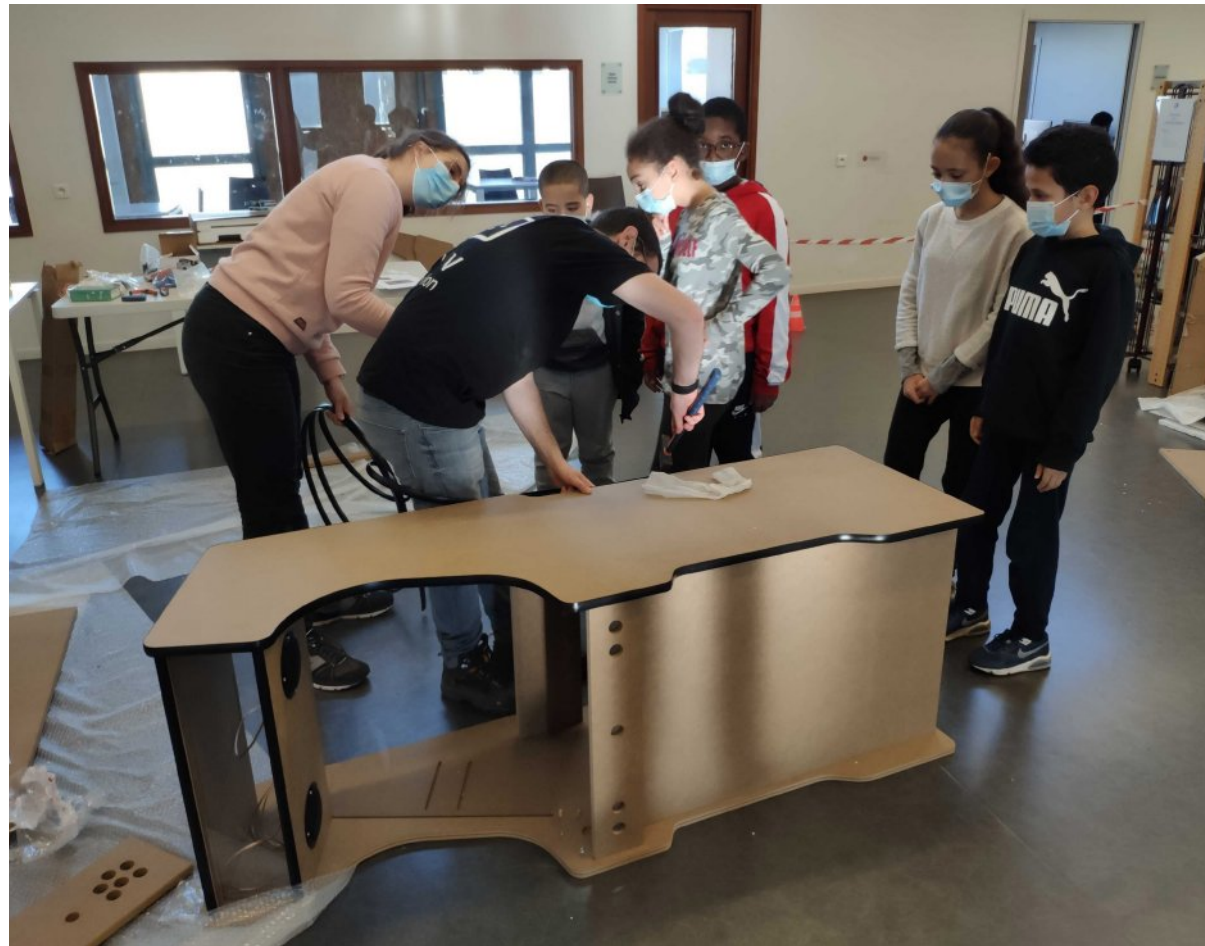
Médiathèque Victor Hugo - Animation construction de deux bornes d'arcade - 4 bénévoles - 4 heures